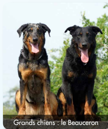
Grands chiens : le Beauceron

Un manque d'exercice en hiver favorise la prise de poids chez les chiens. Ne réduisez donc pas la fréquence de vos promenades !