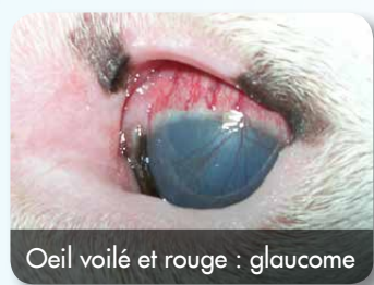
Oeil voilé et rouge : glaucome

Il s'agit d'une augmentation de la pression à l'intérieur de l'oeil.