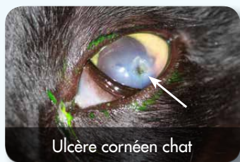
Ulçère cornéen chat

L'ulcère cornéen correspond à une sorte de plaie au niveau de la cornée. Vous remarquerez