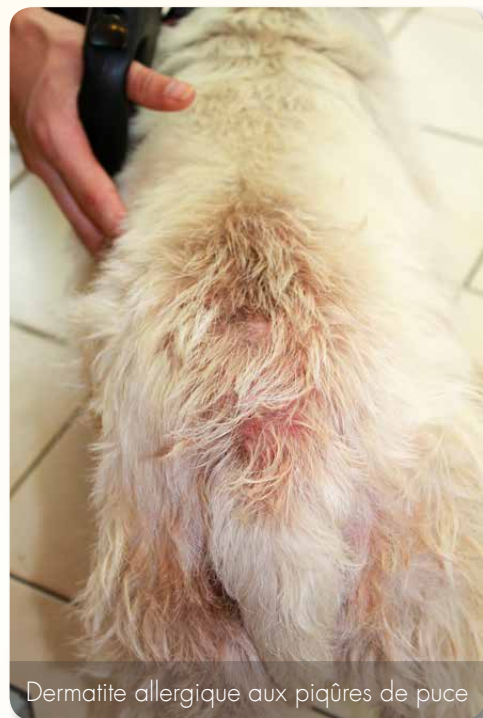
Dermatite allergique aux piqûres de puce

C'est de loin l'affection la plus rencontrée