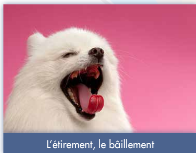
L'étirement, le bâillement