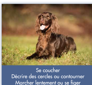
Se coucher Décrire des cercles ou contourner Marcher lentement ou se figer