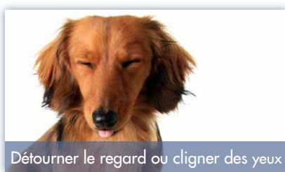
Détourner le regard ou cligner des yeux