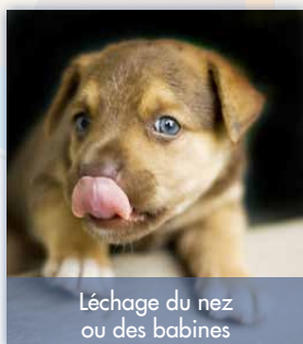
Léchage du nez ou des babines