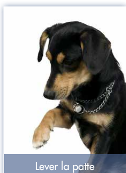
Lever la patte