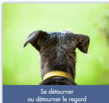
Se détourner ou détourner le regard