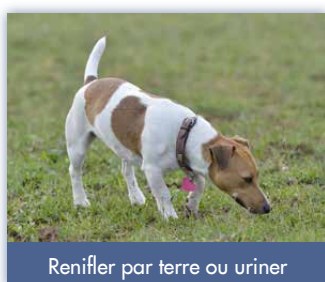
Renifler par terre ou uriner